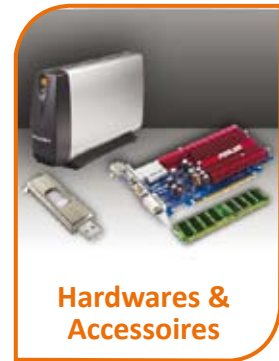
Hardwares & Accessoires