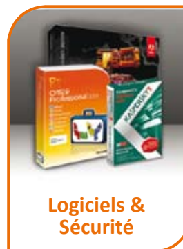
Logiciels & Sécurité