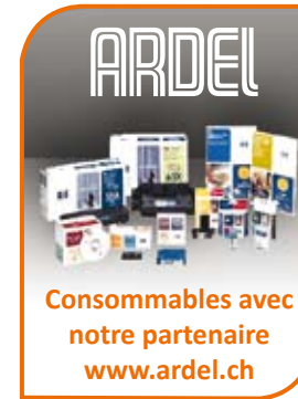
Consommables avec notre partenaire www.ardel.ch