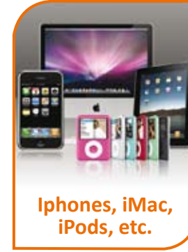
Ipphones, iMac, iPods, etc.