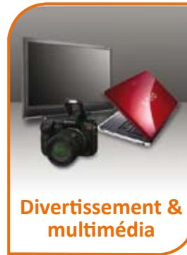
Divertissement & multimédia