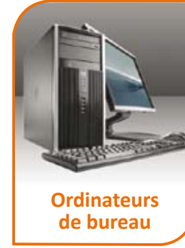
Ordinateurs de bureau