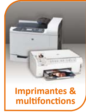
Imprimantes & multifonctions